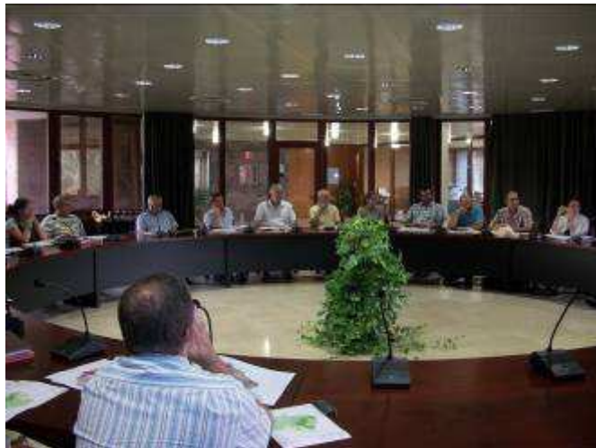
Reunión celebrada el 14 de octubre en el cabildo Insular de La Gomera para presentar las propuestas de zonificación de la Reserva de la Biosfera de La Gomera.