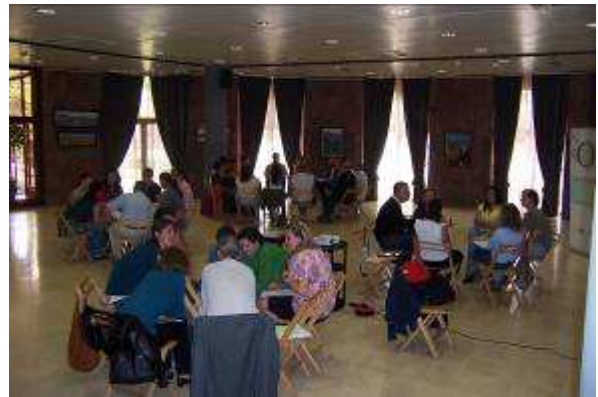
Talleres participativos para la elaboración del Plan Estratégico de la Reserva de la Biosfera de La Gomera en las I Jornadas, el día 5 de mayo de 2010.