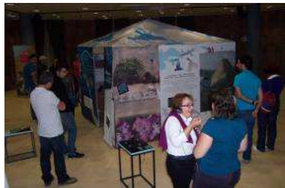
Inauguración de la exposición “La Gomera, donde queremos”.