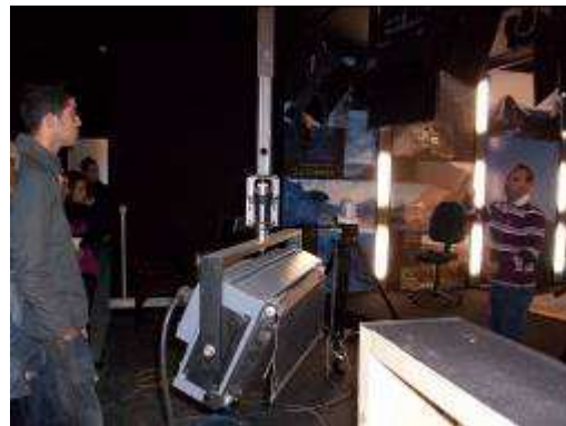
Visita de los chicos del Instituto a las instalaciones del la Radio-Televisión Insular de La Gomera.