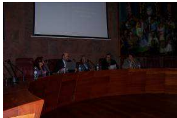
I y II Jornadas Técnicas de “La Reserva de la Biosfera de La Gomera: una oportunidad de futuro”.