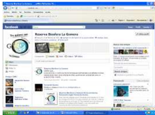
Grupo en Facebook de la Reserva de la Biosfera de La Gomera.